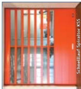
Schnellauf Spiraltor KSS