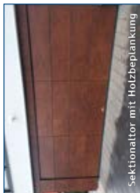
Sektionaltor mit Holzbefpankung